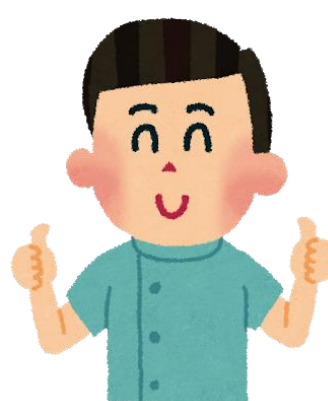
整体師が教える 腰痛にならないため のボディケア講座