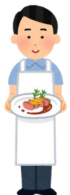
飲食店が教える 家庭でも簡単に できる料理教室

講座例 自分の専門分野や好きなことをお客様にお伝えし、お店のファンを作りましょう！