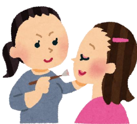
化粧品店が教える メイク教室