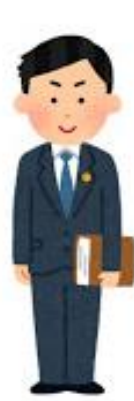
税理士が教える 生前贈与の方法講座